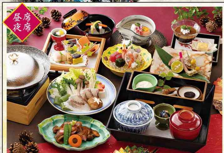
家康公ふるさと会席 6,500円 (税サ込)

『東海道中膝栗毛』には、主人公が岡崎宿で鮎の煮びたしを食べている様子が描かれています。鮎は乙川で多く獲れていた記録があり、家康公も食べていたかもしれません。