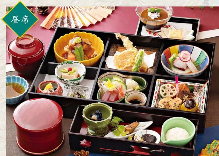
家康公ふるさと御膳 4,000円 (税サ込)